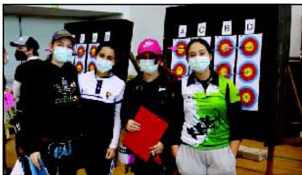
La próxima cita competitiva del Club Tiro con Arco Aranjuez es el domingo 19, en Leganés