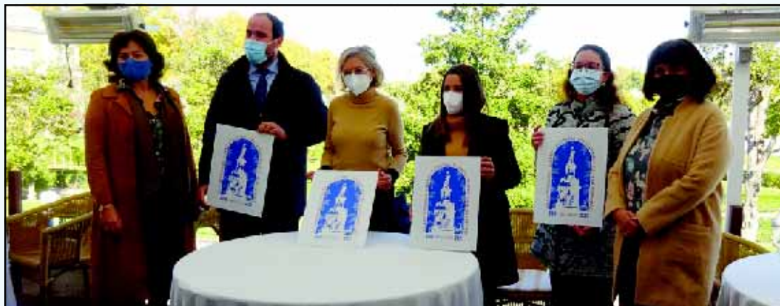
La alcaldesa y algunas de las personas que han intervenido en la preparación del aniversario.

La alcaldesa destacó que "el Paisaje Cultural de Aranjuez es un ejemplo de valor excepcional de la armoniosa conjugación de la obra del hombre con la naturaleza, en una sólida creación donde arte y entorno físico son los protagonistas" y que "actualmente la tutela y conservación de estos bienes naturales, monumentales y culturales, es responsabilidad de varias administraciones del Estado español por lo que nuestro trabajo como gestores es lograr la implicación de todas las administraciones propietarias de este Patrimonio, autonómica y estatal, así como también la de los numerosos agentes sociales y propietarios privados".