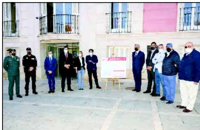
Momento de la presentación de la nueva línea de autobuses que comenzó a funcionar a finales del mes de octubre y que une la estación del tren con el barrio del Mirador, el Hospital del Tajo y la Academia de Oficiales de la Guardia Civil. Además, todas las expediciones de la L5 tienen parada en el inicio del polígono Gonzalo Chacón y se ha creado una nueva parada frente al colegio San José de Calasanz.