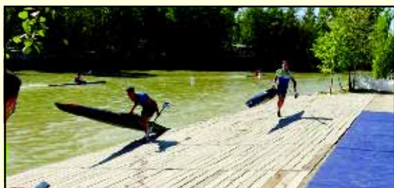
La dificultad de los porteos quedó de manifiesto en esta edición. Los palistas del Club Escuela de Piragüismo Aranjuez subieron al podio.